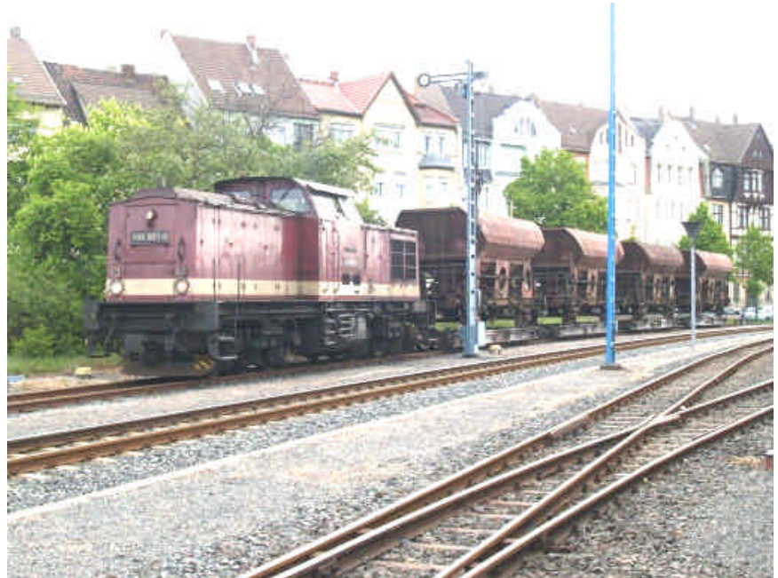
Bild 2: Lok 199 861 vor der HSB eigene Schotterzug. Diesen Zug wird vor allem für die Bahnunterhaltung benutzt um Gleisschotter an zu liefern. Beladen werden die Wagen im Anschluss des Steinbruches Unterberg bei Eisfelder Talmühle. Die Wagen werden auch oft benutzt in Fotogüterzüge.