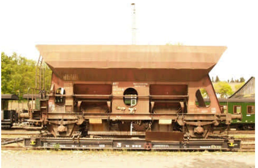
Bild 1: Fcs 00 50 645 2128-8 in Benneckenstein

Auf Schmalspurbahnen waren und sind die Fcs Wagen an zu treffen. Auch bei die Harzer Schmalspurbahnen waren die Fcs Schotterwagen oft zu gast. Sowohl auf Rollwagen als auch auf die Moderne Vevey Rollböcke.