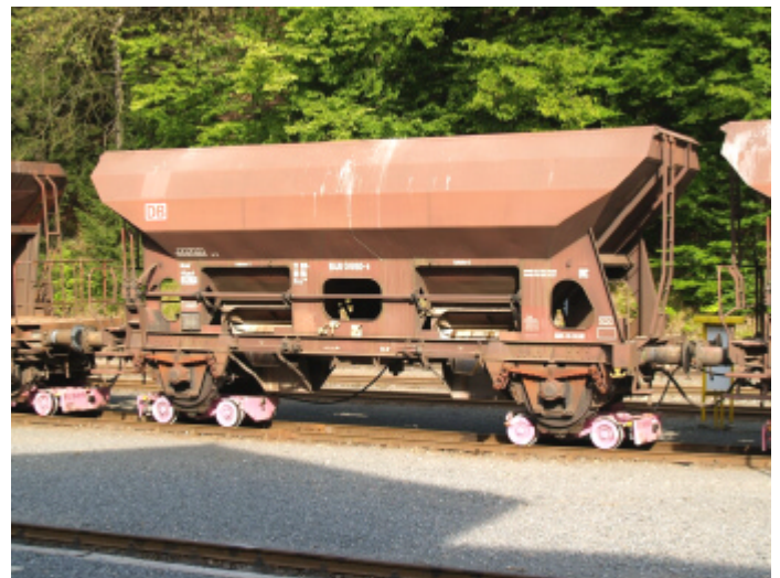
Bild 2: Schotterwagen auf modernen Rollböcken in Eisfelder Talmühle.