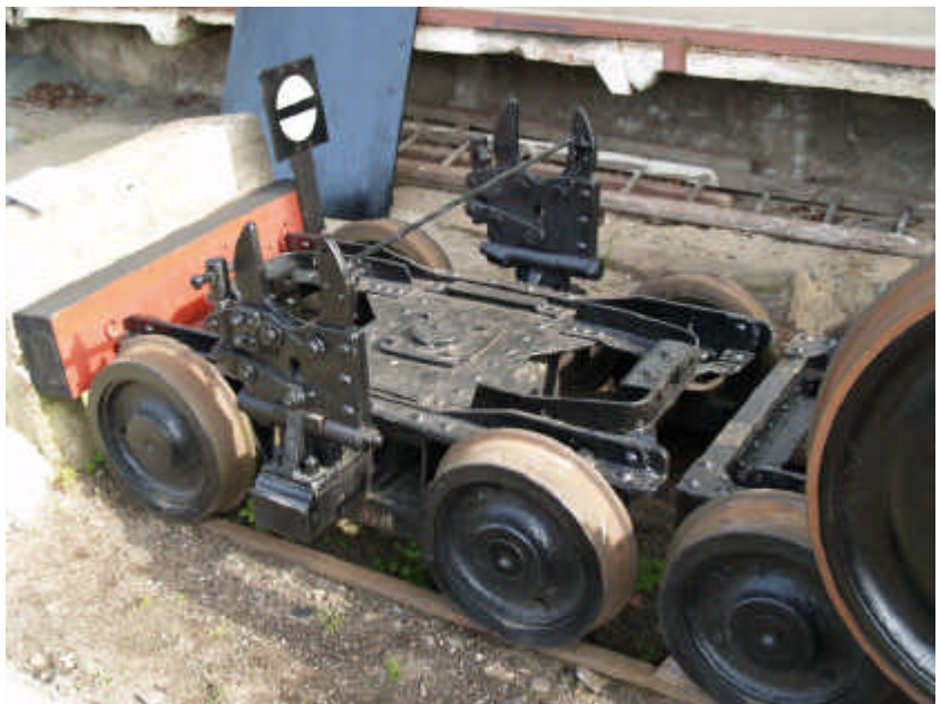
Foto 2: Bij de HSB zijn nog 11 exemplaren van dit type Rollbock bewaard gebleven. Eén daarvan is de 99-01-20 op station Benneckenstein (Duitsland).

In 1949 is de NWE overgenomen door de Deutsche Reichsbahn (DR). De DR zette de Rollböcke nog tot 1990 in. 1993 is het spoorwegnet in de Harz geprivatiseerd en overgenomen door de Harzer Schmalspurbahnen GmbH (HSB). Bij de HSB zijn momenteel nog 11 exemplaren bewaard gebleven.